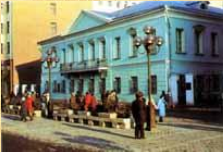
Квартира Пушкина в Москве на Арбате

18 февраля 1831 г. в церкви Вознесения Господня состоялось его венчание с Н.Н.Гончаровой. Первые месяцы семейной жизни он провел с женой в Москве, сняв квартиру на Арбате