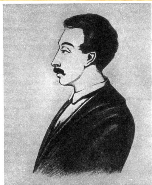
Вильгельм Карлович Кюхельбекер