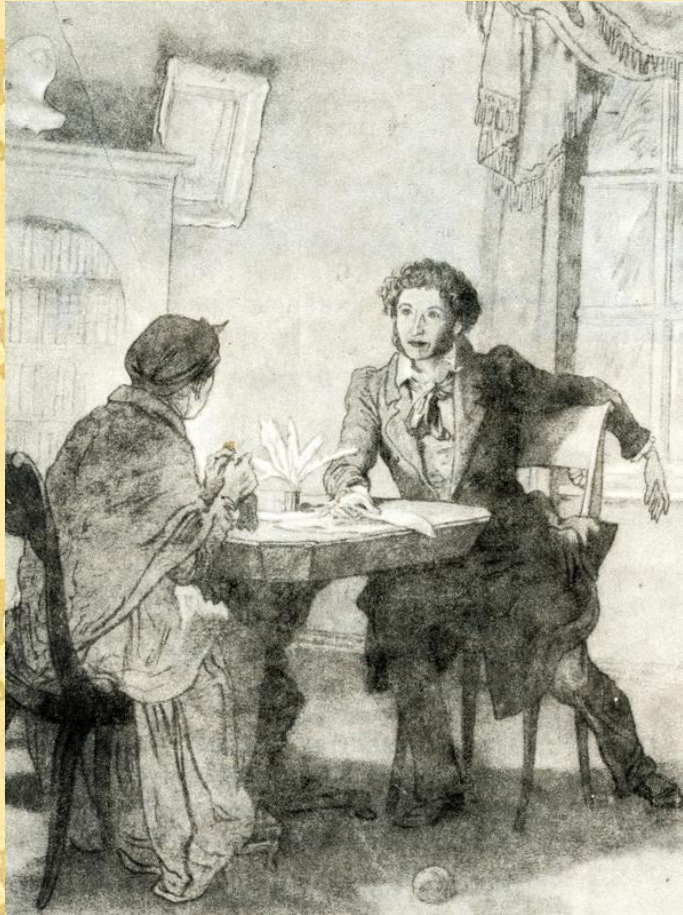
Иллюстрация к стихотворению «Зимний вечер»

Забота и любовь Арины Родионовны скрашивали поэту ссылку. Пушкин по-настоящему крепко любил свою няню и написал несколько трогательных стихотворений, к ней обращенных.