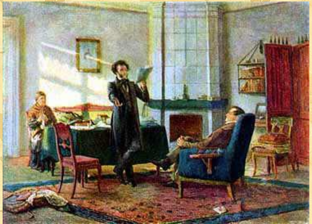
Пушкин в селе Михайловском (Пушкин у Пушкина). Н.Н. Ге. 1875 г.

За три года ссылки написаны "Кавказский пленник", "Бахчисарайский фонтан", а также "Узник", "Песнь о Вещем Олеге». Начат роман в стихах "Евгений Онегин".