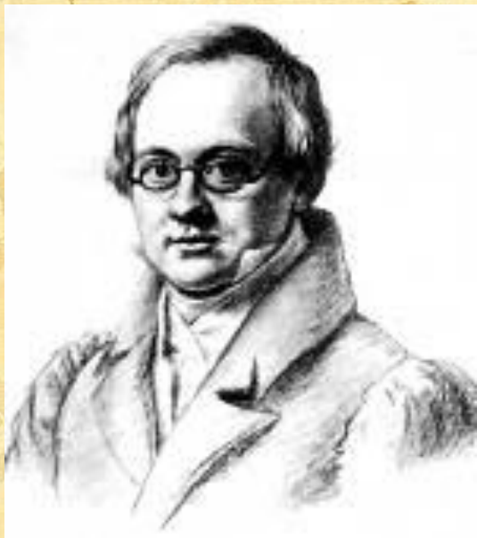
Антон Антонович Дельвиг