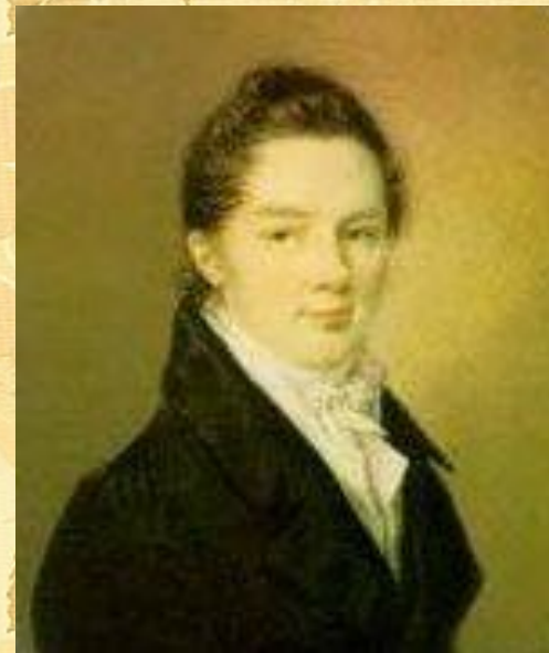
Иван Иванович Пуцин

Пушкин сохранил лицейскую дружбу и культ Лицея на всю жизнь.