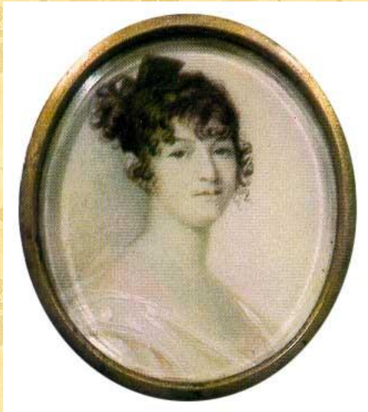
Н.О. Пушкина. 1800-е гг.

Мать, Надежда Осиповна , приходилась внучкой арану Петра I, впоследствии русскому генералу Ганнибалу.