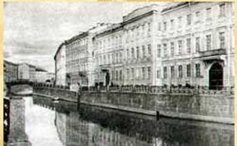
Квартира Пушкина в Петербурге на Набережной Мойки

С середины октября 1831 г. и уже до конца жизни Пушкин с семьей живет в Петербурге.