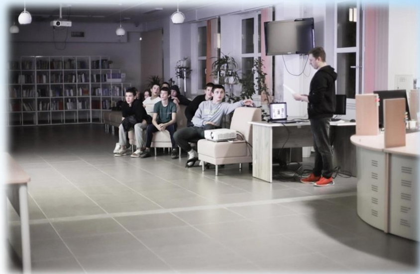
Игровая программа «Юкиор-моя семья»