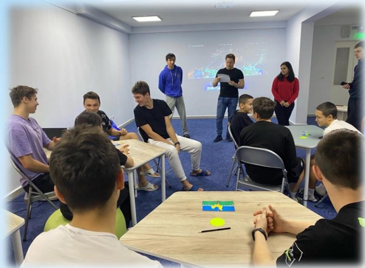
Игровая программа «Я из Югры»