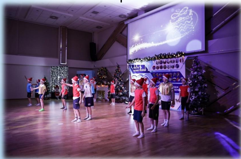
«Новый год 2024»