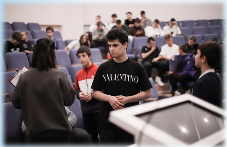
Игровая программа «Юкиор-моя семья»