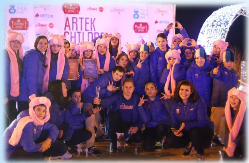
Международный детский центр «Артек»