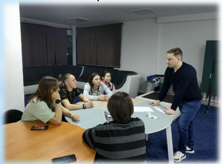
Игровая программа «Юкиор-моя семья»