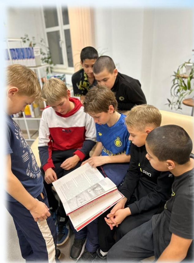
Литературный квест «Однажды в сказке»