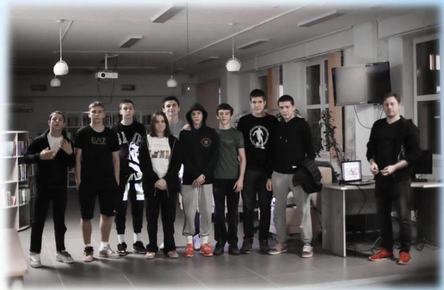
АУ «Югорский колледж-интернат олимпийского резерва»