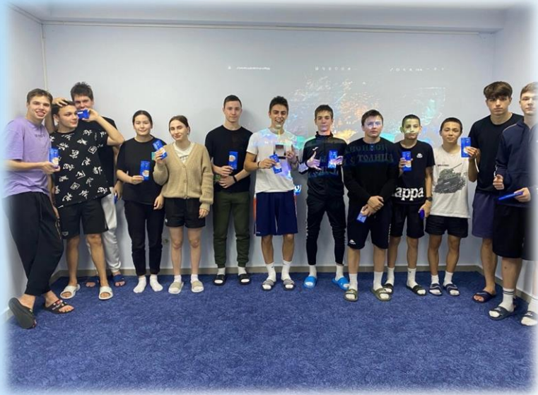
Игровая программа «Космос»